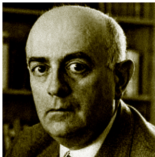
Theodor W. Adorno (1903-1969)